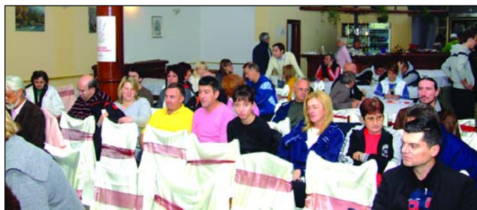
Едукација кроз семинаре

Из Удружења апелују на све запослене у колективу да им се прикључе у што већем броју, те да дају свој допринос у развијању хуманости и солидарности, што је од изузетно значаја за све.