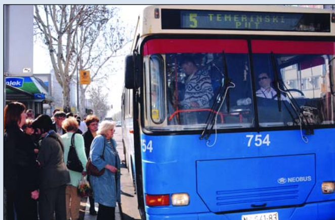
Путници препознали труд запослених у ЈГСП

На питање "Шта су добро урадиле власти у Граду?", један од одговора испитаника био је и ЈГСП, односно све везано за градски пре-