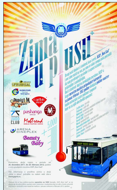
Промо плакат акције

У намери да празнике учини пријатнијим и занимљивијим, за време трајања школског распуста ЈГСП Нови Сад спроводи акцију "Зима у плусу". Првих 5000 ученика и студената који купе месечну ђачку маркицу припадајуће категорије, током акције могу да остваре разне поклоне и попусте које су за њих обезбедили спонзори: пицерија