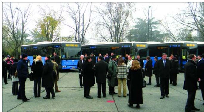
У 2011. години набављено 26 нових аутобуса

АНКЕТА - На нашем сајту анкетирамо путнике да ли су задовољни новим аутобусима ИВЕКО Ирис, који су пуштени у саобраћај 2. децембра. Већина, 67,75 одсто је изузетно задовољна са 15 нових аутобуса јер су комфорни, климатизовани и прилагођени потребама инвалидних лица. Део путника, односно 15,7 одсто, задовољно је због чињенице да возила имају моторе Е5 који задовољавају све еколошке потребе, док 17,18 одсто није задовољно новим аутобусима.