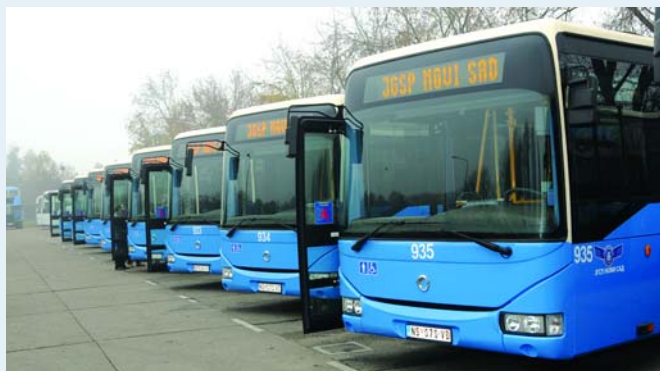
Добри, поуздани и комфорни

Он наглашава да наши возачи имају само речи похвале о овим аутобусима и да су се брзо навикли на