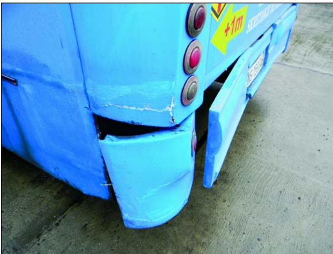
Запослени дужни да надокнаде штете коју су проузроковали

Запослени који има сазнања о насталој штети дужан је да насталу штету пријави руководиоцу организационе јединице предузећа у којој је запослени за кога се основано сумња да је проузроковао штету распоређен и да преда писану изјаву на околности које су му познате, а везане су са њеним настанком.