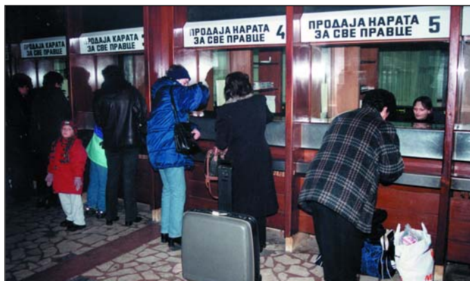
Новинама до већег прихода станице

У области пружања станичне услуге, у периоду који је из нас, ЈСП Нови Сад је предњачио у односу на друге аутобуске станице у земљи. Како би одржали континуитет и висок ниво пружања услуге у условима у којима се послује, предузеће улаже у техничко технолошке иновације и едукацију запослених. Примена нове апликације за продају карата резултираће ефикасном продајом карата, затим ефикаснијим и квалитетнијим надзором о продаји и приходима које аутобуска станица остварује, биће омогућено пружање брзих и различитих извештаја превозницима, те генерисање разних извештаја за руководство станице и предузећа.