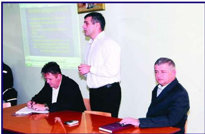
Трибина Удружења возача

Од новембра возачи ће на својим четворточкашима морати да имају и најмање две