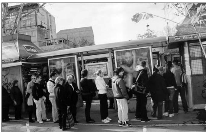
Код Футошке пијаце

Приликом продаје новембарских маркица уведена је још једна новина. Наиме, продаја маркица за учеснике са регресираним ценом, организована је на шалтеру 18, на Међумесној аутобуској станици