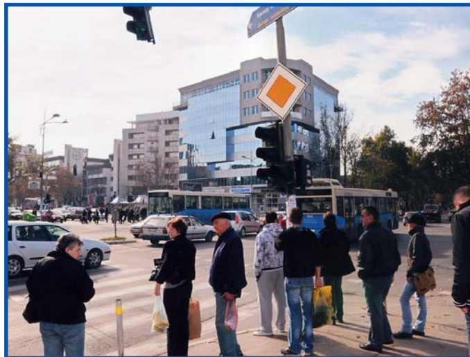
"Шпицеви" током целог дана

захтева за покретање кривичног и 68 захтева за покретање прекршајног поступка, против возача ЈГСП-а. У пр-