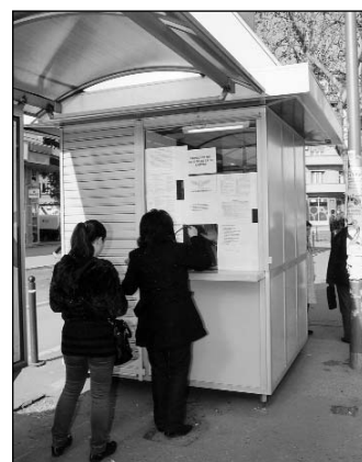
Преко пута Футошке пијаце

Иначе, почетком месеца и поред новоотворених продајних места, уочене су гужве на терминалима у Шафариковој улици, код Футошке пијаце и на Железничкој станици. Занимљиво је да су грађани и поред редова, углавном одбијали да уваже препоруке наших контролора, који су их обавештавали о томе да се на пример, преко пута Футошке пијаце, испред Алфа банке, налази ново