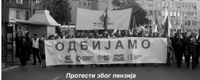
Протести због пензија

Синдикат "Нови Сад 1911" саопштава да је због изостанка планираних инвестиција, у делу обнове возног парка, угрожена реализација Зимског реда вожње, чија је примена почела 1. новембра.