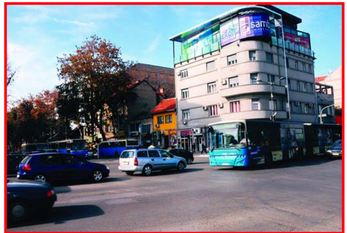
Зимски ред вожње

Подсетимо, кампања наливања антифриза у систем за хлађење, завршена је 18.