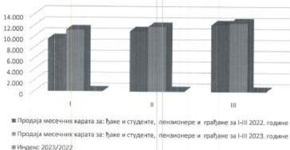
Графички приказ броја продатих месечних карата за ђаке и студенте, пензионере и грађане за период 01.01.-31.03.2023. године у односу на исти период претходне године